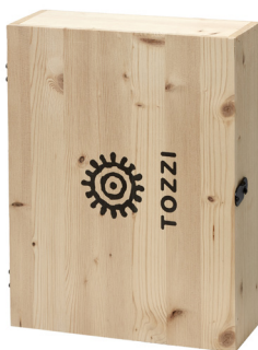
cod.H3 3 bottiglie