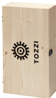
cod.H2 2 bottiglie