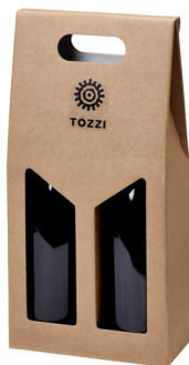
cod.I2 2 bottiglie