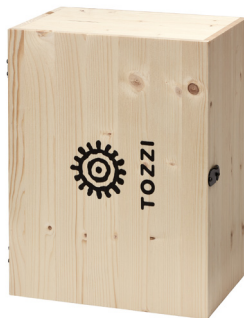
cod.H4 6 bottiglie