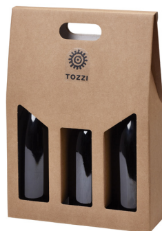
cod.I3 3 bottiglie